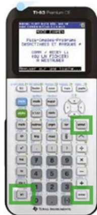
TI 83 CE