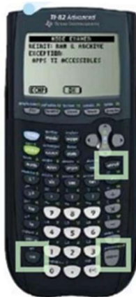
TI 82 Advanced